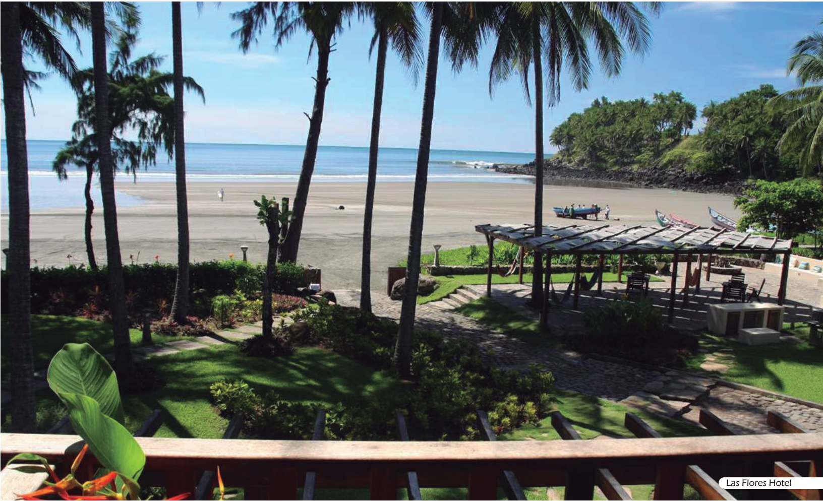
Las Flores Hotel