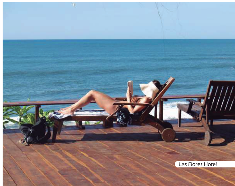
Las Flores Hotel