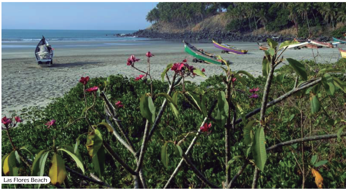
Las Flores Beach