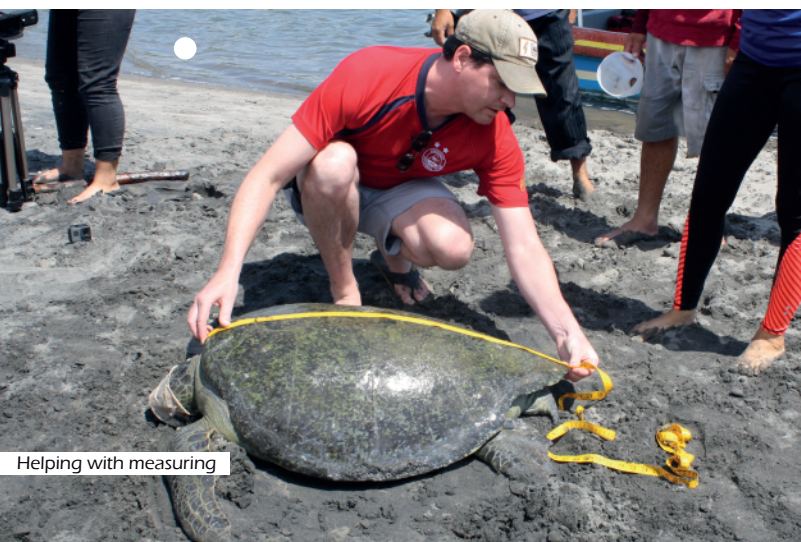
Helping with measuring