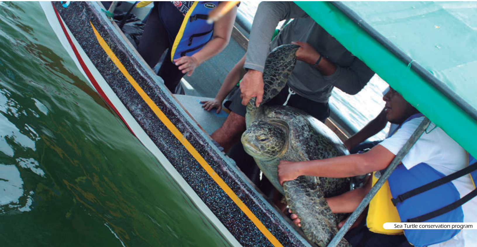
Sea Turtle conservation program

Hospedaje en Puerto Barillas (Casa de Árbol).