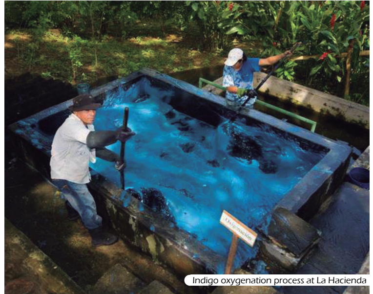
Indigo oxygenation process at La Hacienda