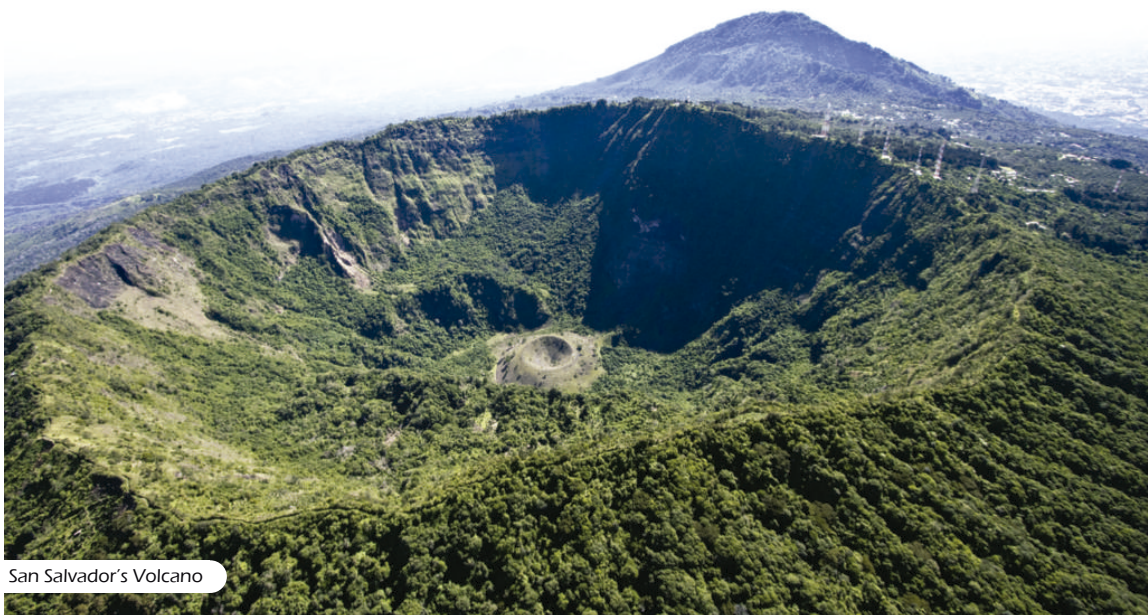
San Salvador's Volcano