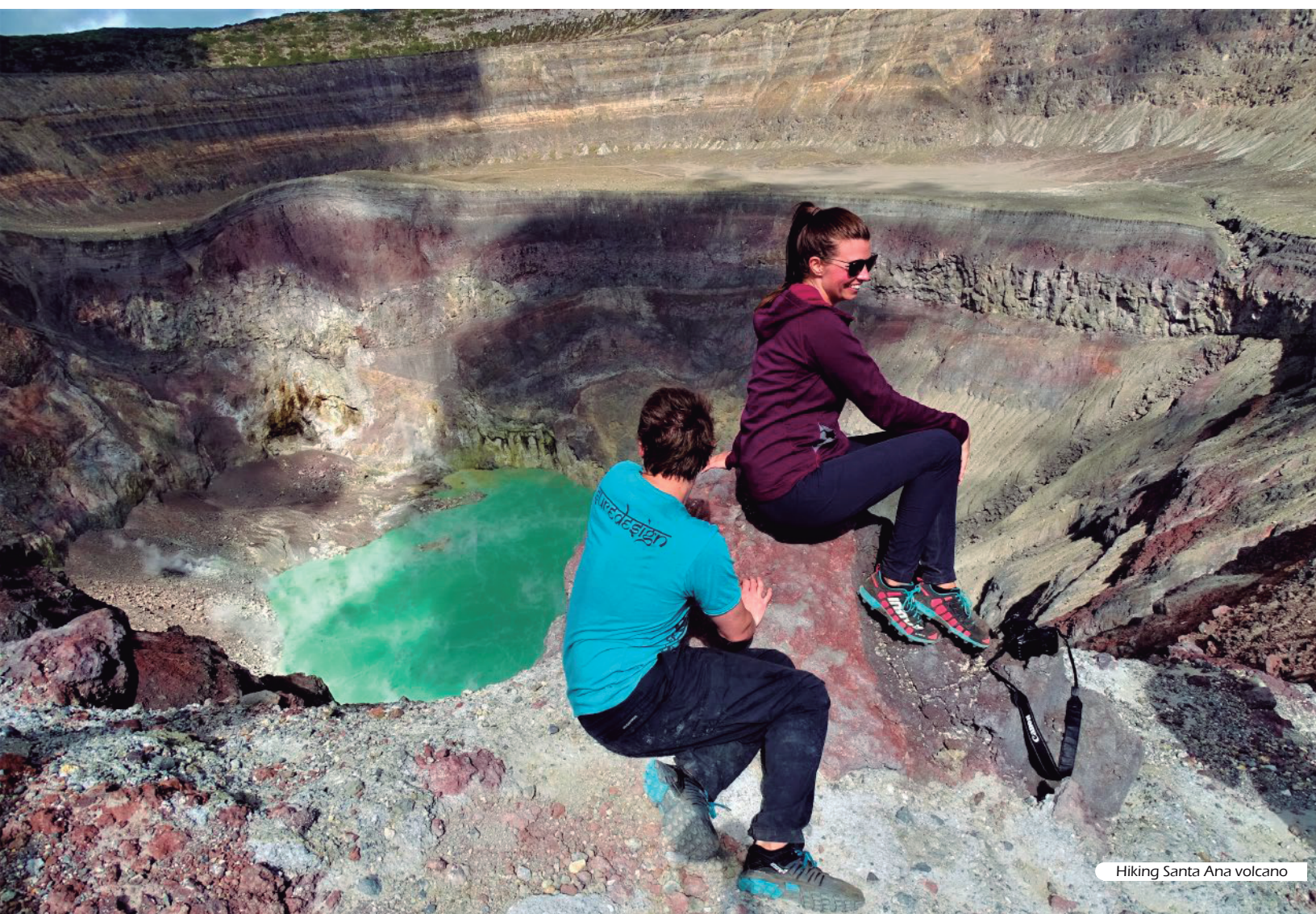
Hiking Santa Ana volcano