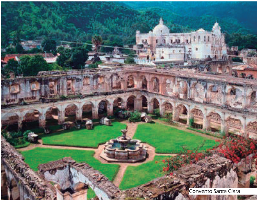
Convento Santa Clara