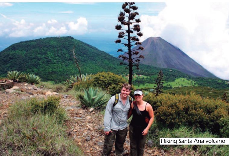
Hiking Santa Ana volcano