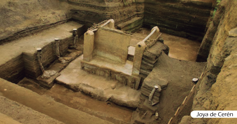
Joya de Cerén