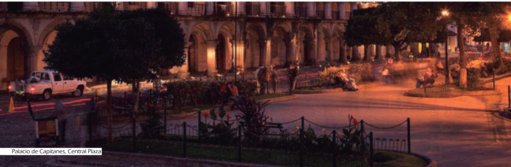
Palacio de Capitanes, Central Plaza