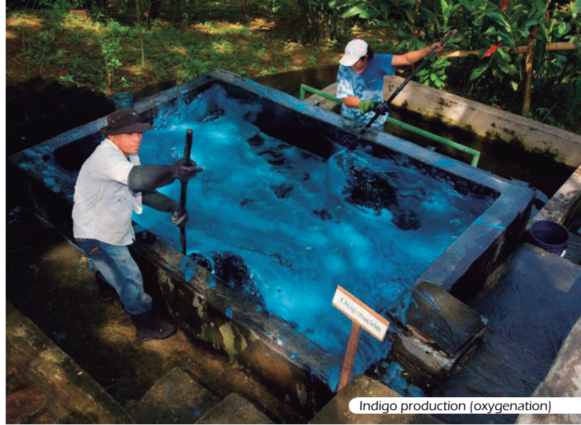
Indigo production (oxygenation)