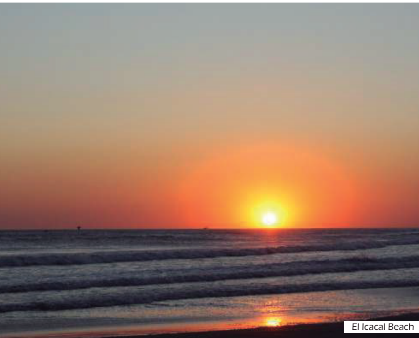
El Icacal Beach