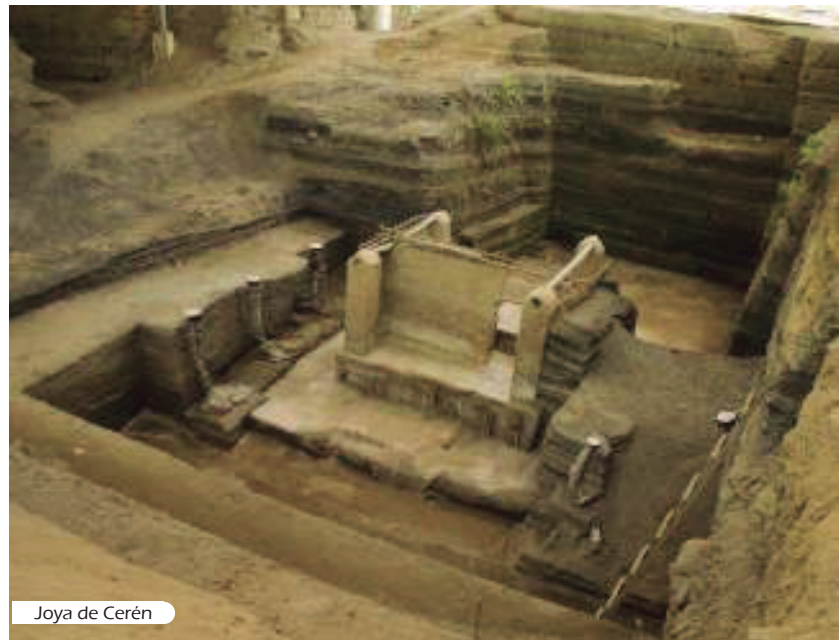
Joya de Cerén