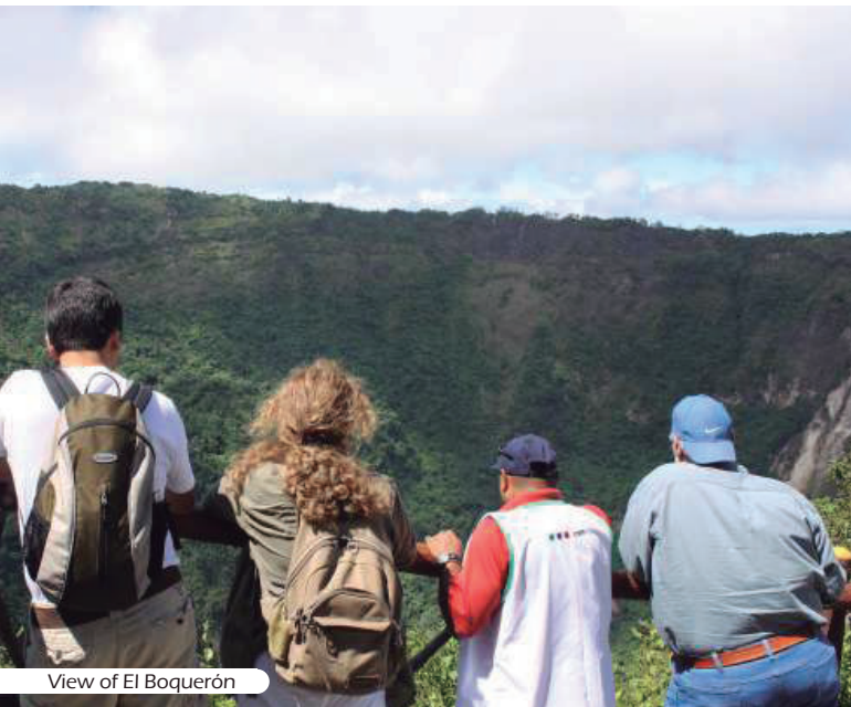
View of El Boquerón