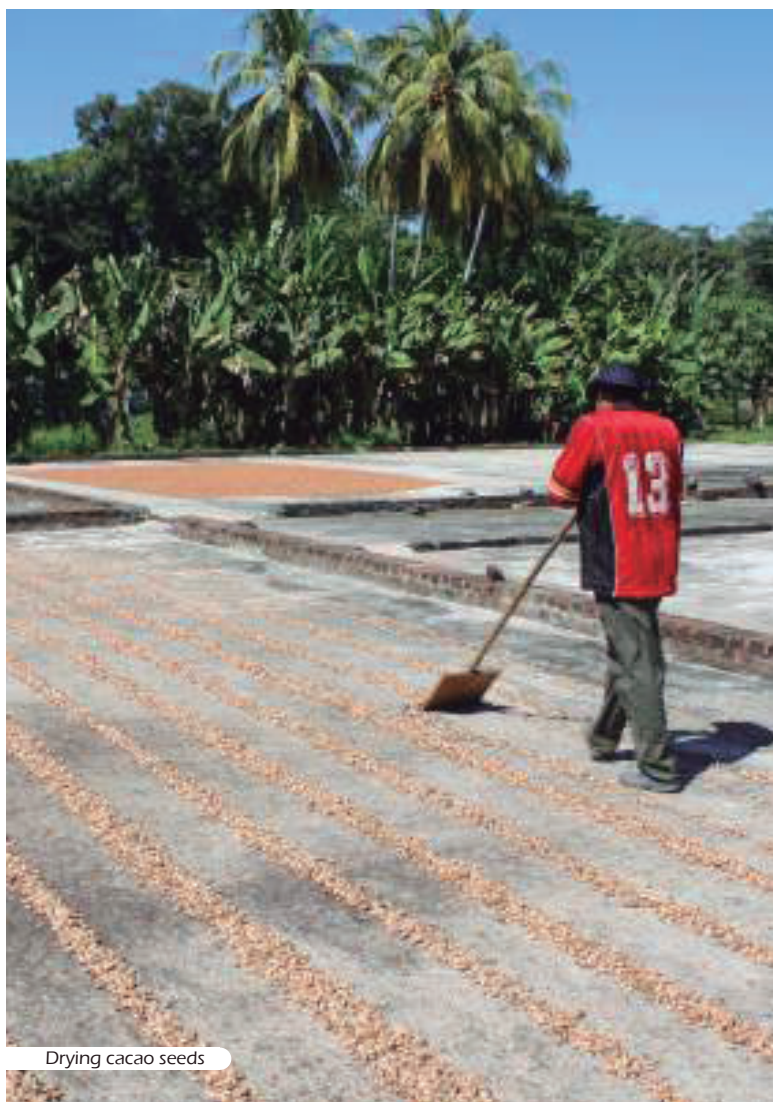
Drying cacao seeds