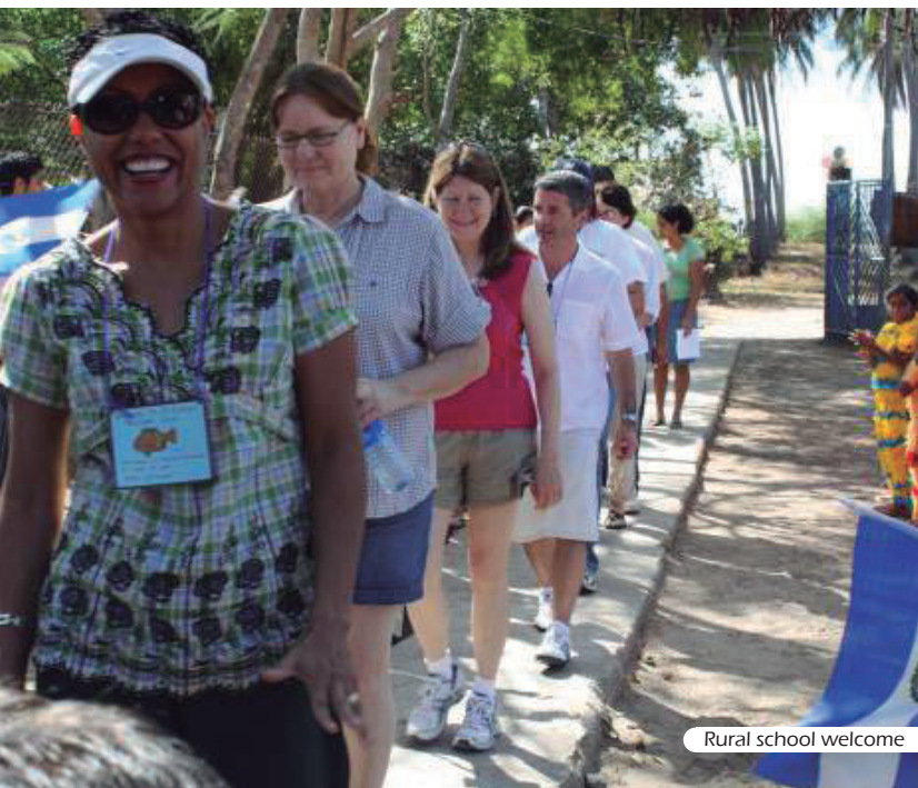
Rural school welcome