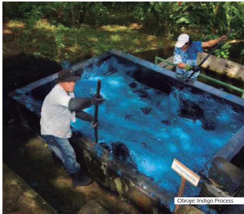
Obraje: Indigo Process