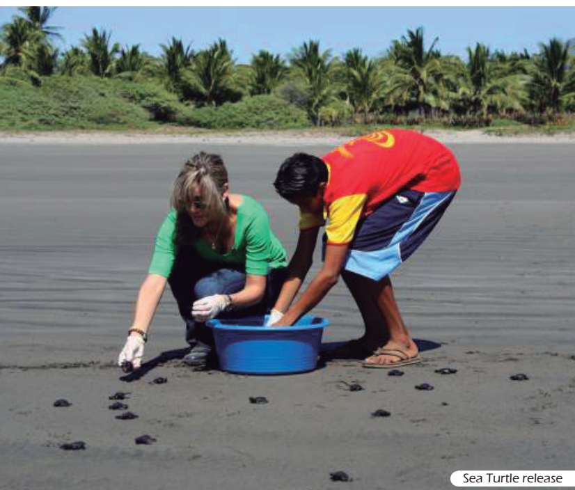
Sea Turtle release