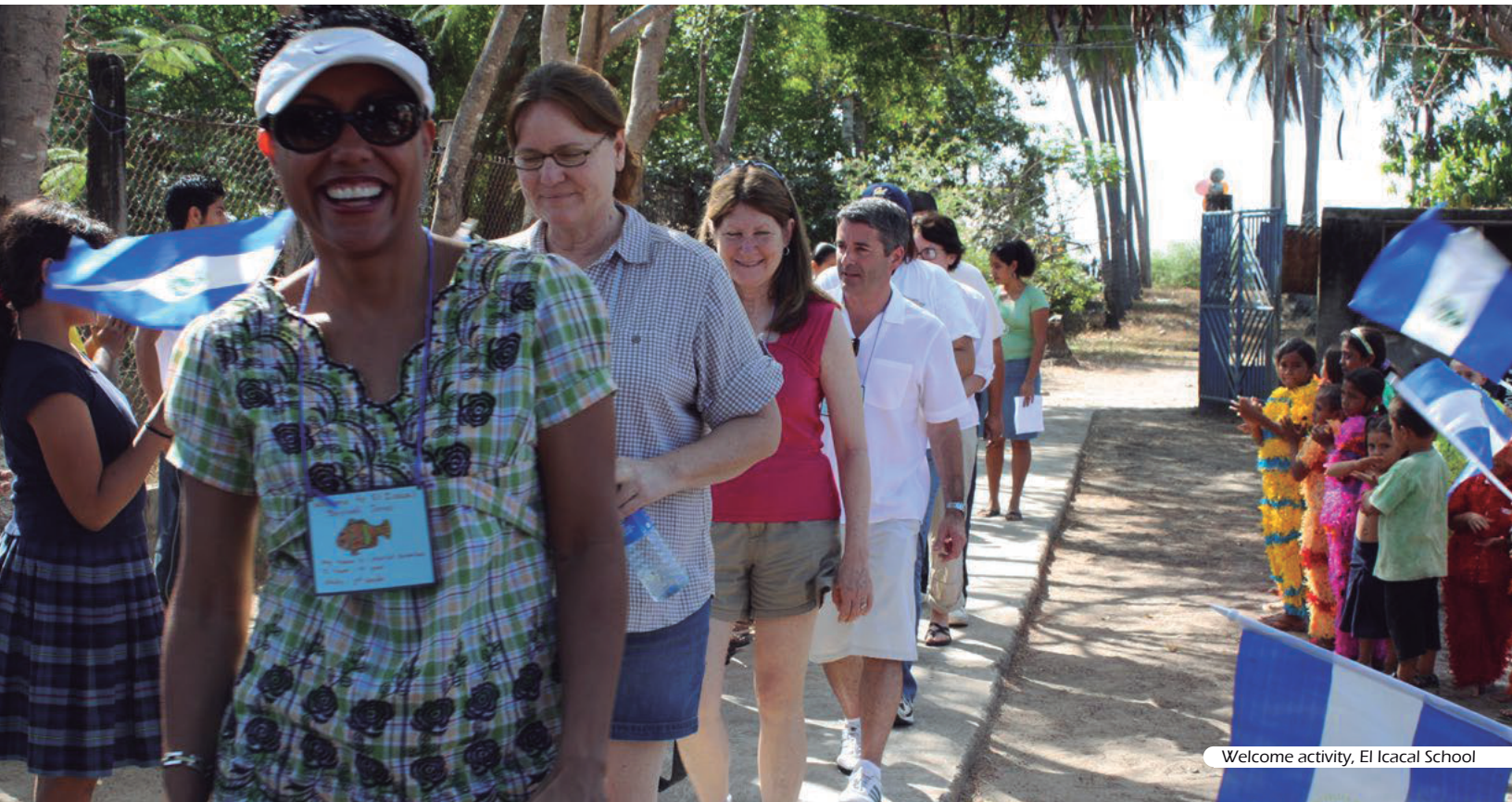
Welcome activity, El Icacal School