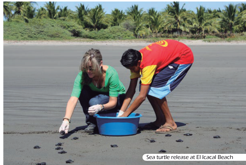
Sea turtle release at El Icacal Beach