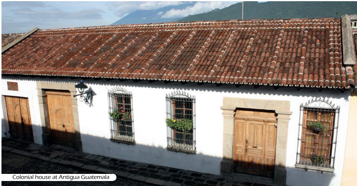
Colonial house at Antigua Guatemala