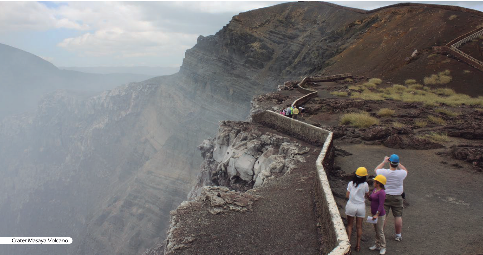
Crater Masaya Volcano