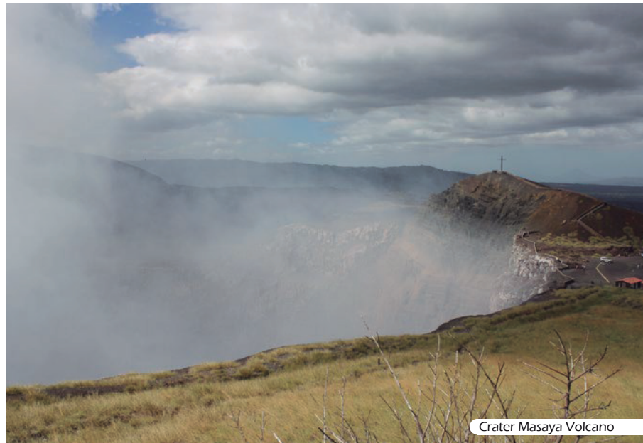
Crater Masaya Volcano