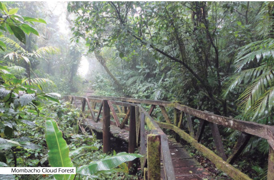
Mombacho Cloud Forest