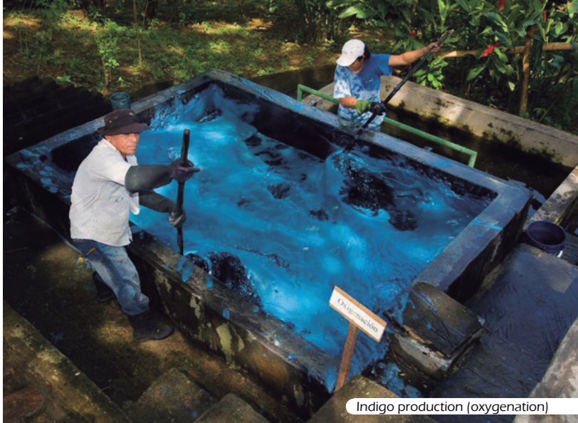
Indigo production (oxygenation)