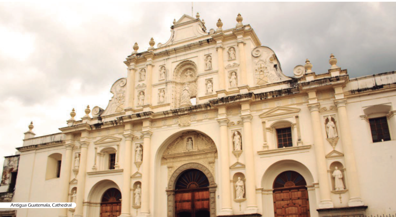
Antigua Guatemala, Cathedral