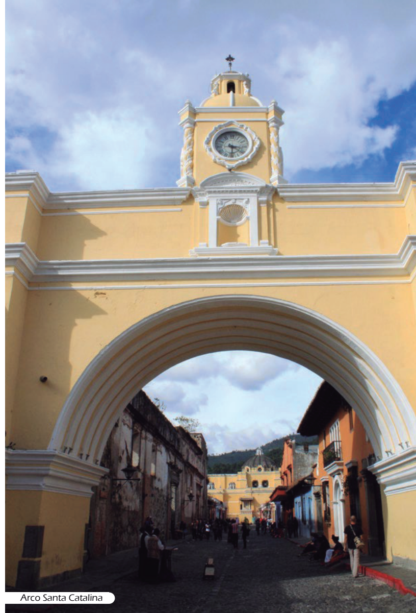
Arco Santa Catalina