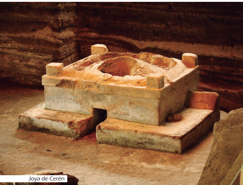
Joya de Cerén