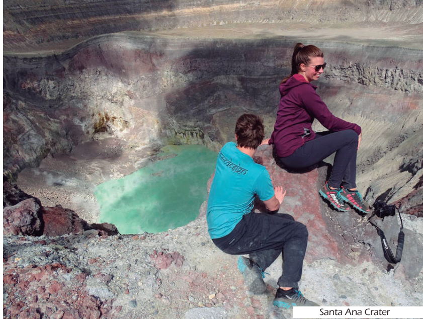
Santa Ana Crater