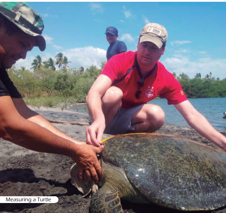
Measuring a Turtle