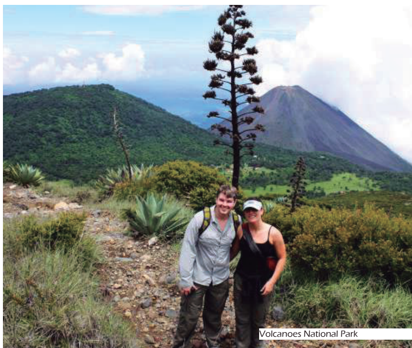
Volcanoes National Park