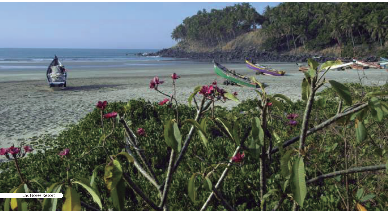
Las Flores Resort