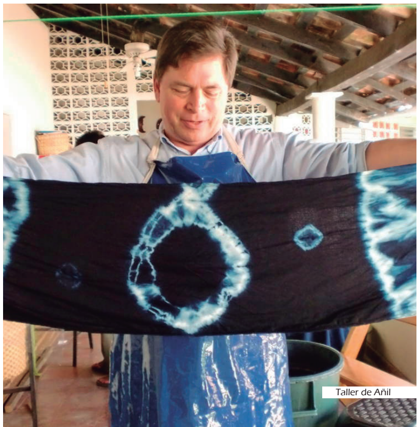
Taller de Añil