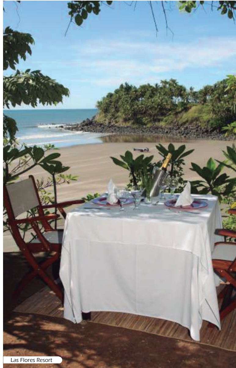
Las Flores Resort